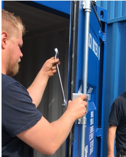
7. Drag fast låskåpan och öglan med muttrarna.