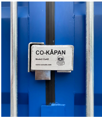
11. Låset är färdigmonterat och du låser det enkelt med ett hänglås i klass 4 (med kort bygel).