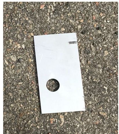
Ev. Skulle dörrar på containern ej liva så att ögla för hänglås ej kommer helt i låshuset så finns distansbricka som kan läggas mellan container och låsögla.