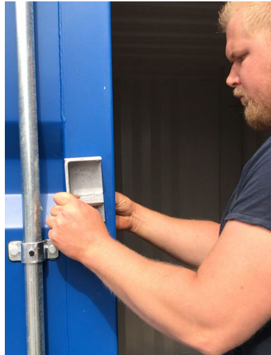
8. Montera vänstra delen av låskåpan på samma sätt.