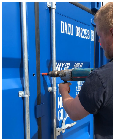
Du kan även borra hålen med vanlig bormaskin med hålsåg. Se bild.