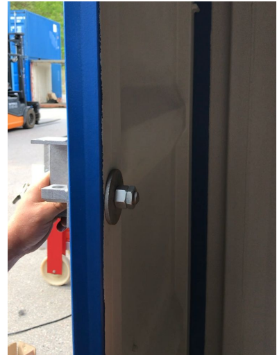
9. Sätt ditt bricka samt de 2 muttrarna.